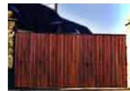
Portails bois, alu et PVC